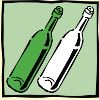
Bunt- bzw. Weißglasbehälter