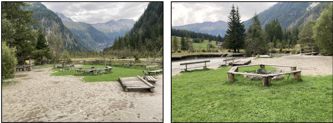
Grillplätze im Uferbereich des Mallnitzbaches