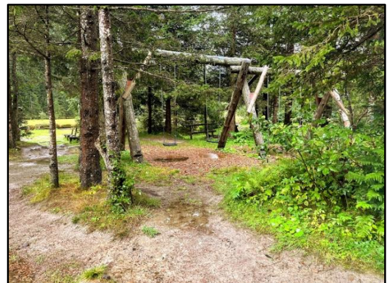
Spielgeräte im Freizeitzentrum vor dem Abbau