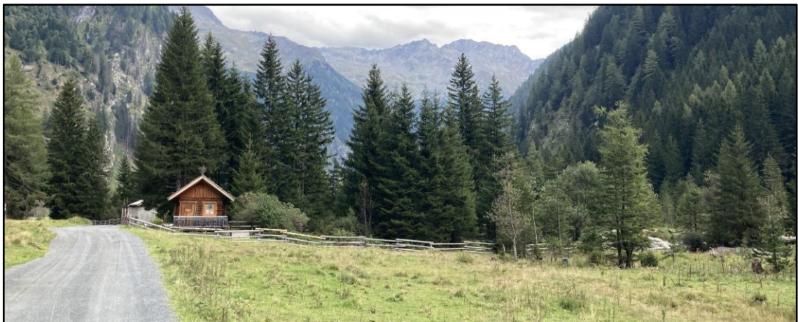
Blick auf das Freizeitzentrum samt WC-Gebäude aus westlicher Richtung

Das Freizeitzentrum Seebachtal befindet sich am Beginn des Wanderweges ins Seebachtal, westlich des Stappitzer Sees. Der ca. 3.200 m 2 große Abenteuerspielplatz ist in einem lichten Waldstück zwischen dem Wanderweg und dem Mallnitzbach situiert. Die Anlage bestand aus einem öffentlichen WC, mehreren Spielgeräten (Seilrutsche, Schaukeln, Rutschen, Holzbrücken) sowie einigen Sitzbänken mit Grillmöglichkeit im Uferbereich des Baches. Die Spielgeräte waren zum Großteil aus Holz und fügten sich harmonisch in den Naturraum ein. Insgesamt stellte das Freizeitzentrum einen touristisch bedeutenden Erlebnispark für Familien mit Kindern am stark frequentierten Seebachtal-Wanderweg dar.