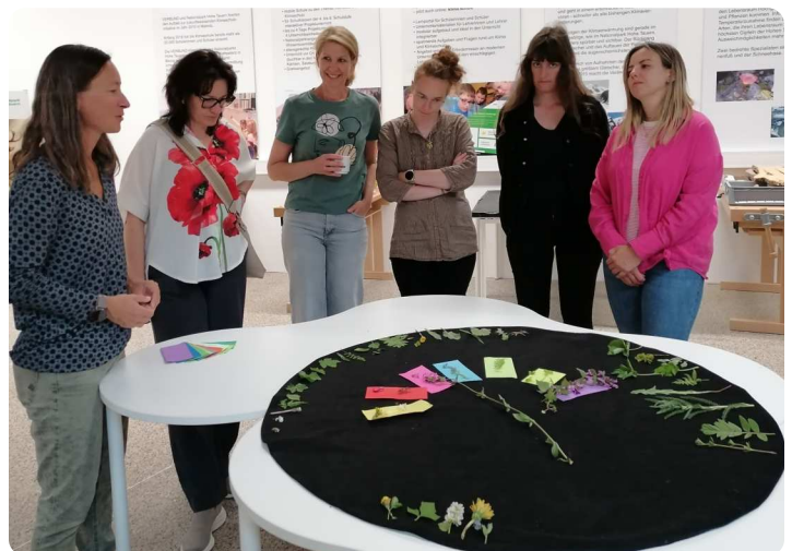
Die Vielfalt der Farben und Blattformen in der Natur entdecken!