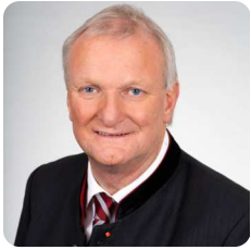
Günther Novak Bürgermeister