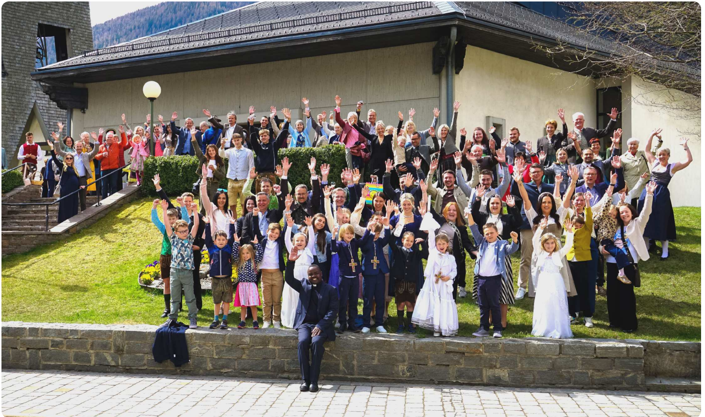
Ein schönes und würdiges Fest für die Erstkommunikationskinder und die gesamte Pfarre Mallnitz