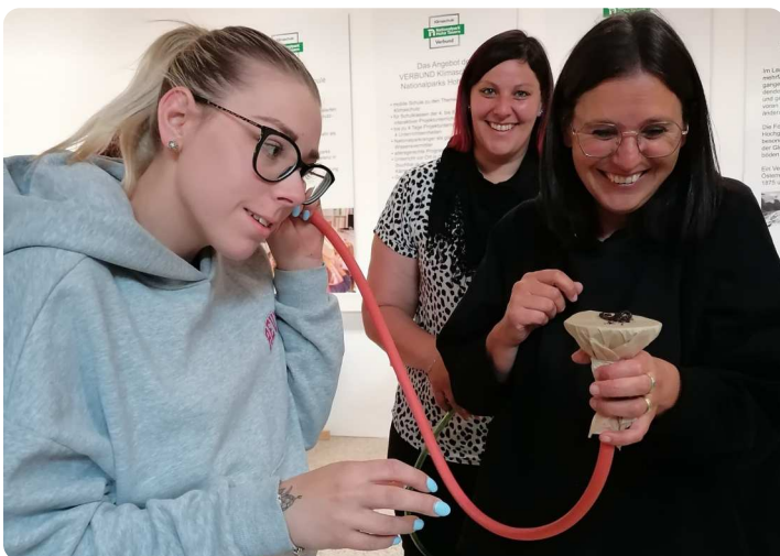
Mit Hilfe eines Verstärkers einem Regenwurm zuhören!